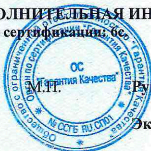
Схема сертификации: бсо